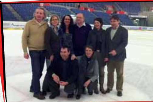
Am 4. Februar 2011 besuchte das Königshaus das Eishockey-Spiel der Krefeld Pinguine gegen die Hannover Scorpions, den amtierenden deutschen Meister, welches die Pinguine verdient mit 5:1 gewannen. Nach der Siegesfeier entstand das Bild auf der Eisfläche des König-Palastes.