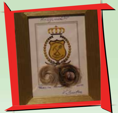
Die beiden eingerahmten Locken unseres Kriegsministers Volker Berten

Tragen die Freien Bauern ihre „dorfpolitischen Forderungen“ ähnlich wechselhaft an König Ulrich I. heran, können wir uns, liebe Bewohner des Königreichs Traar, auf höchst amüsante Rededuelle einstellen. Verpassen Sie also nicht die Abendveranstaltungen beim diesjährigen Schützenfest.